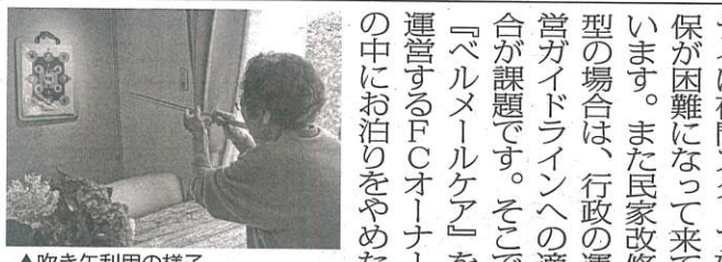
▲吹き矢利用の様子

イ(以下「お泊りデイ」)は「ブルーミングケア」を直営・FC合計で約50カ所開設予定(含む)展開する。このブルーミングケアは、ほかのお泊りデイFC事業者が手掛けていたが同社が事業を譲受した。また民家改修型のお泊りデイ「ベルメールケア」も直営・FCで1088店舗展開しており、「ケアフィットルーム」は3タイプ目のデザインとなる。「人手不足でお泊り